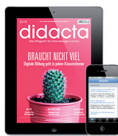
APPS & E-MAGAZINE