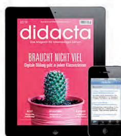
APPS & E-MAGAZINE